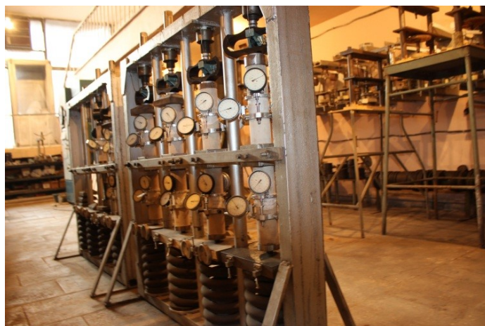
Фиг. 2: Силовая установка для испытания цементогрунтных образцов на длительное сжатие в рабочем состоянии

Экспериментальные исследования ползучести цементогрунтных цилиндрических элементов были осуществлены на пружинных силовых установках (фиг.2).