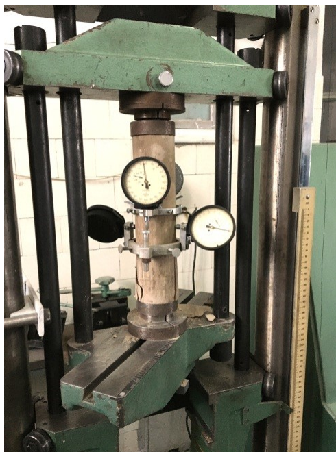
Фиг. 1: Цементогрунтный образец, установленный на испытательной машине

Был использован цементогрунт на основе белоземов, взятых с участков, соседствующих территории Института физики, находящегося в жилом районе Ачалняк г. Еревана. На основе данных проведенных соответствующих анализов (анализы химического и соляного содержания материала, просеянного через сито №2) было установлено, что использованные белоземы представлены пылеватыми супесями (белозем карбонатного состава). В качестве связующего компонента использовался портландцемент марки 40, производимый Араратским цементным заводом (Республика Армения). Для получения мокрой смеси цементогрунта применялась обычная трубопроводная вода. Опытные образцы, полученные способом прямого прессования, освобождались из форм через 14 сут. после изготовления. В дальнейшем, до момента проведения экспериментальных исследований в возрасте (время, отсчитываемое после изготовления) 42 сут., они находились во влажных опилках.